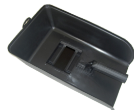
Hand welding mask MM1010 Masque à main MM1010