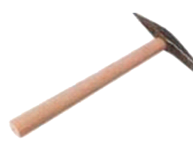
Chipping hammer 525g Marteau à piquer 525g