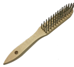
Steel brush (4 row) Brosse acier 4 rangs