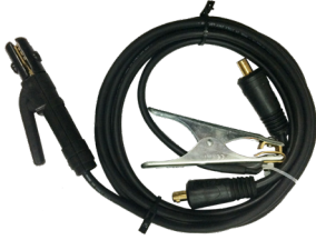
Welding cables 200A Jeu de câbles 200A